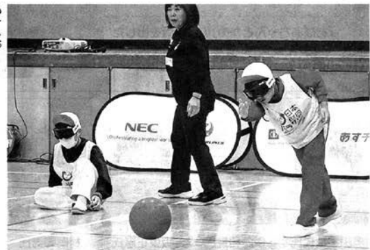
目隠しをしてボールを投げる子どもたち